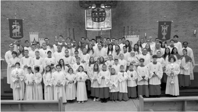
Gruppenbild der ca. 80 Ministranten nach der Vorabendmesse in Aglasterhausen