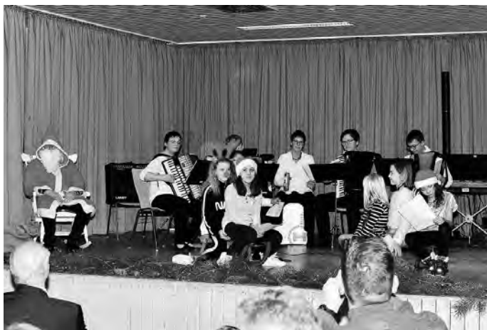
Nikolaus zu Besuch beim HCH.